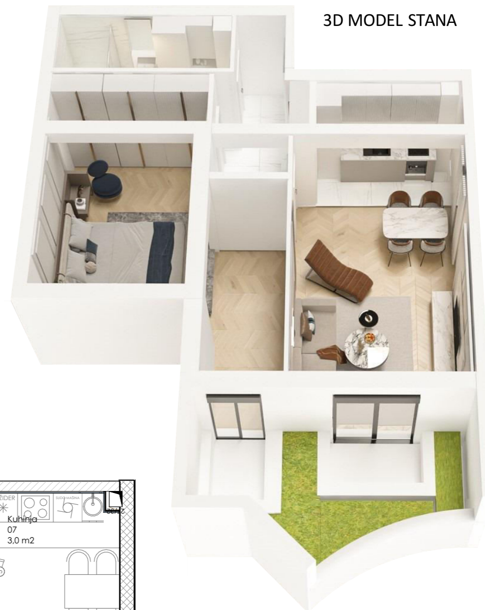
3D MODEL STANA